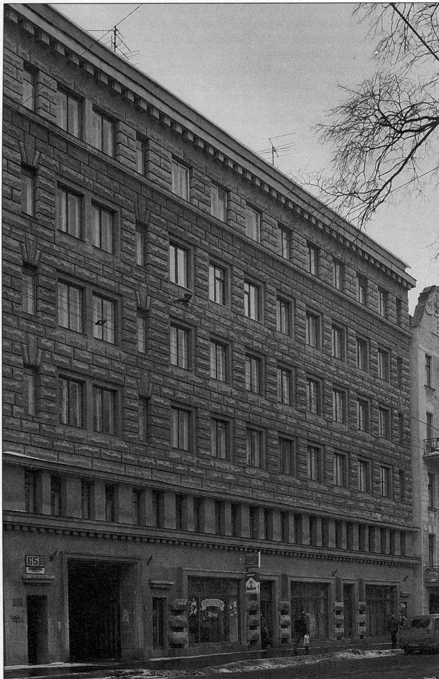
Жилой дом на Кронверкском проспекте, 65.