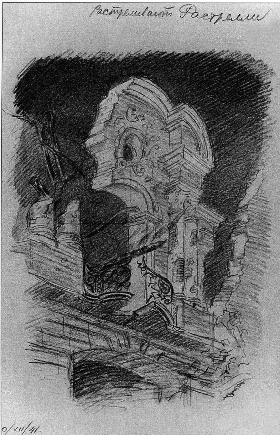
Из серии «Расстрелянный Растрелли». 1941 г.