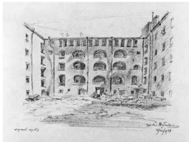
Илл. 3. Двор дома по Мучному пер., 3. Рис. Я. О. Рубанчика, 1944

Очередная глава посвящена домам галерейного типа. Многие старинные здания внешне строгие и простые с первого взгляда, поражали автора неожиданной архитектурой: «Такие дворы не похожи на обычный двор-колодец со стенами, «издырявленными» окнами. Это открытые или застекленные галереи в три-четыре яруса, покоящиеся на каменных столбах или многоярусных аркадах. Они придают фасаду глубину и третье измерение, в тоже время от такого типа постройки веет уютom жилья» (илл. 3). Далее Рубанчик описывает скромный четырехэтажный дом № 84 на Фонтанке (илл. 1). Единственное украшение лицевого фасада – это пара колонн дорического ордера по бокам ворот. Но за воротами в проезде во двор, как отмечал автор, «возникает лес мощных дорических колонн, силуэтно рисующихся на залитых солнцем дворовых фасадах». Особый интерес он проявляет к застройке главной магистрали города. В 40-х гг. XX в. Невский проспект и прилегавшие к нему кварталы были насыщены галерейными домами с аркадами в первых этажах, создавая практическое удобство обитателям столицы: в жару и дождь можно было укрыться в галереях.