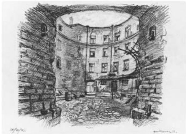
Илл. 2. Двор дома по наб. р. Фонтанки, 94. Рис. Я. О. Рубанчика, 1943

дворце и Мальтийской капелле, построенных в разное время разными зодчими. Рубанчик справедливо замечал: «Кваренги смело водружал свои постройки в самую гущу барокко. Везде, где бы ни ставил он их, везде и всюду оставаясь самим собой, уважая и чтя соседа, он корректно входил в эту, уже до него сложившуюся среду и вписывался в нее».