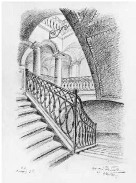
Илл. 4. Лестница дома по 1-ой линии, 8. Рис. Я. О. Рубанчика, 1944

Мойки расположился Строгановский дворец Растрелли. Далее – дворец Разумовского, чьи флигели соединены высокой оградой с монументальной каменной аркой. Изгиб речки скрывает дальнейшую застройку. Отрезок до ул. Дзержинского сохранился с начала прошлого века нетронутым. Время и люди пощадили эти участки старого города: «Здесь с необыкновенным чувством умиротворения и покоя можно пройтись в золотую осень, когда вековые клены и липы за оградой осторожно сбрасывают на гранит тротуара легкие листья и они, не подметенные, шуршат под ногами. Здесь почти нет звуков города. Здесь малоллюдно и спокойно».